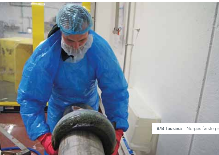
B/B Taurana – Norges første prosessfartøy