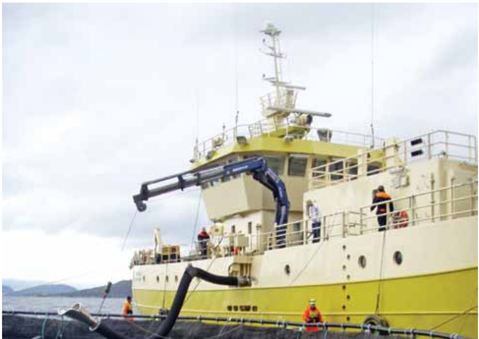
B/B Taurana – Norges første prosessfartøy

- Korrekt behandling av laksen ved merd gir B/B Tauranga større rekkevidde og mer tid før laksen må pumpes inn til videreførdling. Fartøyet bør tømmes så raskt som mulig. Jo lengre man venter, desto større sjanser for skader, sier Midling.