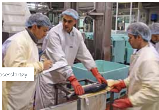
B/B Taurana – Norges første prosessfartøy

-Det er verdt å merke seg at mange av gjenstående utfordringer kan relateres til trenging, hard behandling ombord og for dårlig kontroll med Rigor mortis. Dette er da også viktige mål i optimaliseringen som nå gjøres i Marine Harvest, avslutter Midling.